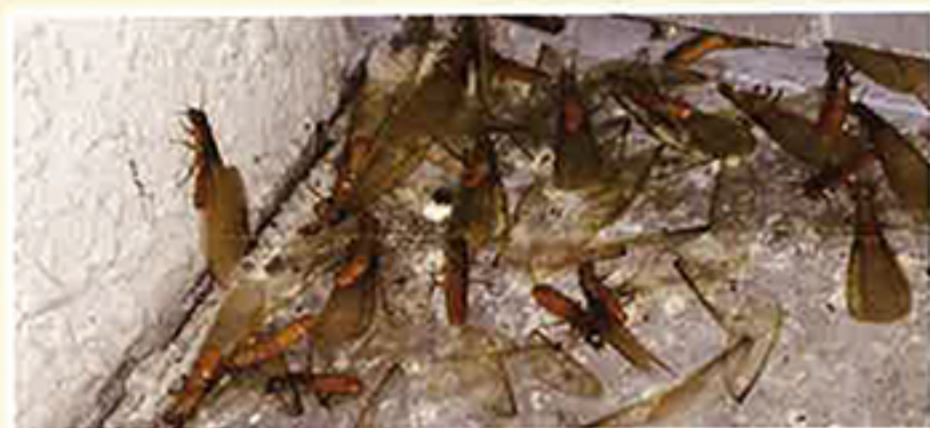
イエシロアリ (羽アリ)

日本で建造物に大きな被害を与えるのはイエシロアリとヤマトシロアリの2種類です。前者では6月～7月の夕方頃に、後者ではゴールデンウィーク前後の日中に羽蟻が群飛します。これらの羽蟻を見つけることで、シロアリ被害に気づくことがあります。