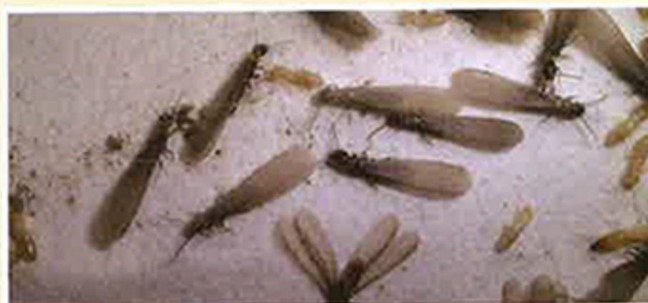
ヤマトシロアリ (羽アリ、働きアリ、兵隊アリ)