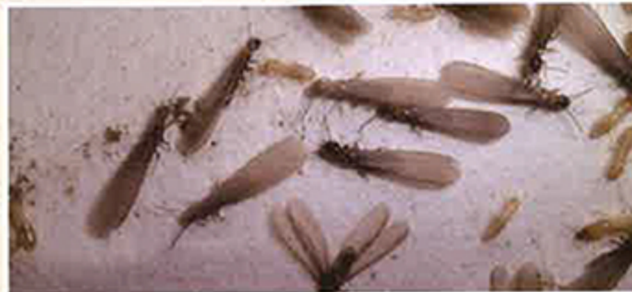
ヤマトシロアリ (羽アリ、働きアリ、兵隊アリ)