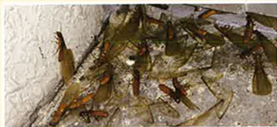
イエシロアリ (羽アリ)

日本で建造物に大きな被害を与えるのはイエシロアリとヤマトシロアリの2種類です。前者では6月～7月の夕方頃に、後者ではゴールデンウィーク前後の日中に羽蟻が群飛します。これらの羽蟻を見つけることで、シロアリ被害に気づくことがあります。